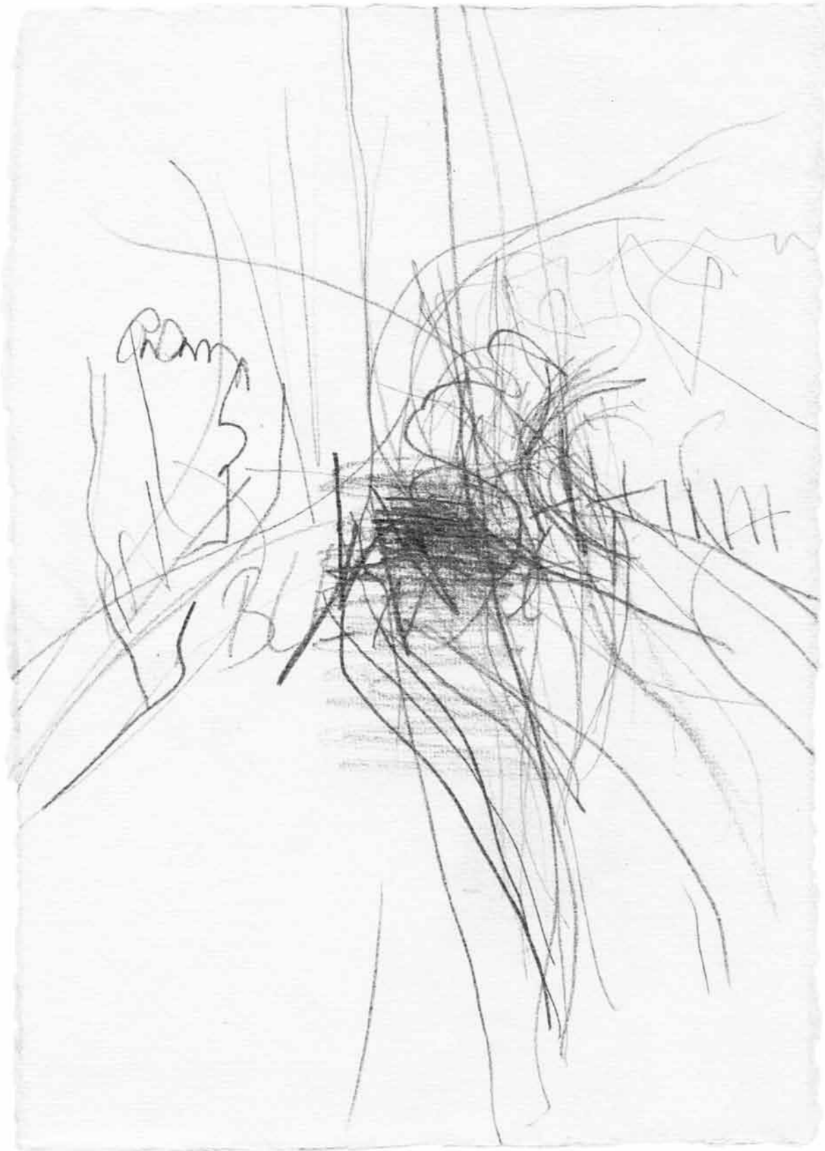
Laterne überm Deich 4. Gang Deich Hase