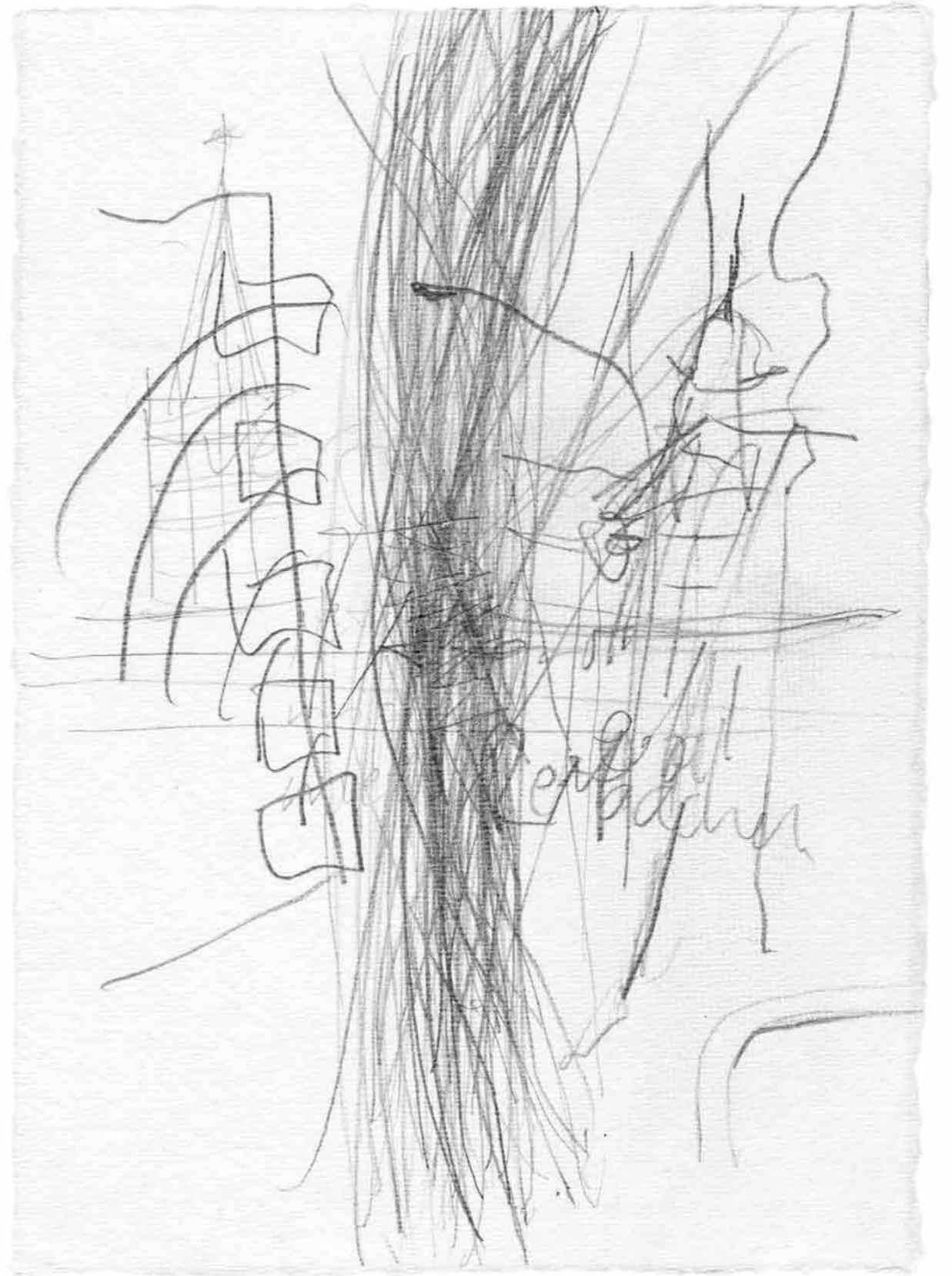
auf nach Berlin! Mist falsche Richtung. einmal um die Spitze Wow! Sturmflut alles nass